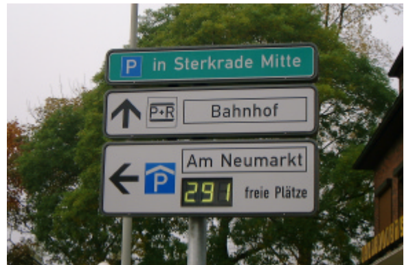
Parkleitsystem mit TiMO III Funkmodem (Antenne oberhalb der Anzeigetafeln)

gungssicherheit und ggf. Frequenzabstand zu anderen Sendern, zu berücksichtigen, sondern auch Umgebungsbedingungen, wie Geländebeschaffenheit, Bebauung und Bewuchs. Dazu kommen für das genutzte Frequenzband spezifische Vorschriften, die sowohl Frequenz, Kanalraster und Sendezeiten und damit die effektiv mögliche Übertragungsrate des Funkmoduls betreffen, als auch Leistung, Antenne und Reichweite, aber auch die Frage ob Sender und Empfänger ortsfest oder mobil sein sollen.