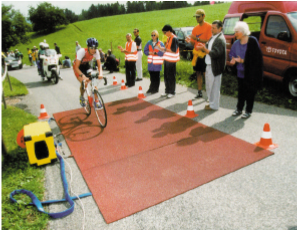
Zeitmessung bei der Duathlon-WM "Powerman" in Zofingen/Schweiz (Datenübertragung mit TiMO III Funkmodem)

Datenübertragungsraten werden dadurch eingeschränkt; andererseits sind Frequenz und Zeitschlitz für den Nutzer geschützt, d.h. in seinem Sendebereich nur ihm vorbehalten, um Störungen zu vermeiden.