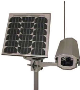
Videokamera mit Funkübertragung (z.B. Übertragung von komprimierten Standbildern im 1/4 Minuten Takt)

Sind bei einer Aufgabenstellung Datenraten bis 19,2 Kbaud gefordert, so bietet die Datenübertragung mit TiMO III Funkmodems deutliche Vorteile gegenüber leitungsgebundenen Kommunikationsmedien, Modacom, Bündelfunk oder GSM: